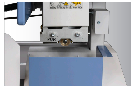
Jednoduchá a bezpečná aplikace lepidla

Lepička Fastbind Pureva Neo je také vybavena zcela novým typem kolejničového mechanismu aplikátoru lepidla. Aplikátor nanášení lepidla tak klouže po hřbetu knižním bloku téměř bez odporu. Velká rukojeť aplikátoru je umístěna nízko před aplikátorem tak, aby se dále zvýšila jednoduchost obsluhy.